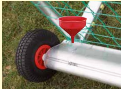
Gewichtsrohr angeschweißt zur Befüllung mit trockenem Quarzsand