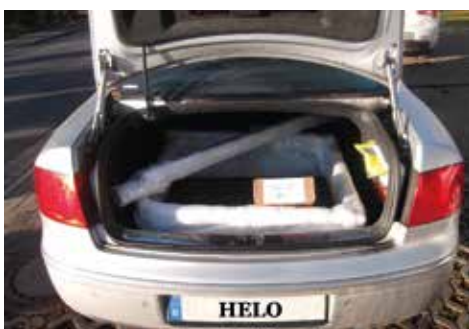
120 x 80 cm passt in jedes Auto

Freistehende Tore sind gegen Umkippen zu sichern!