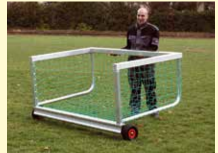
Transportrollen • Das Tor ist mit den beiden Rollen leicht und einfach zu verfahren.