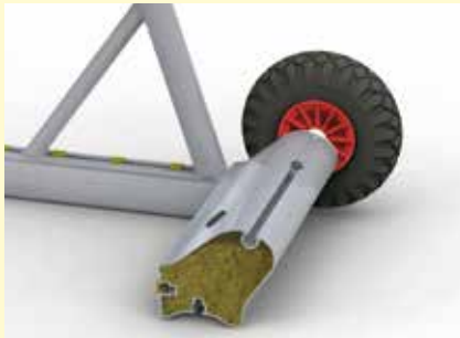
Gewichtsrohr im verletzungsneutralen , formschönen Design