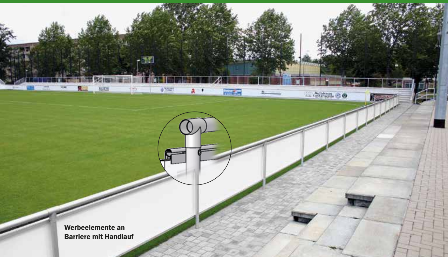
Werbeelemente an Barriere mit Handlauf