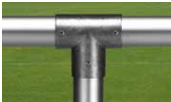
T-Verbindungselement mit gefasteten Kanten Art.-Nr. 1303