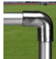
Bogen- / Endstück Art.-Nr. 1304 90°