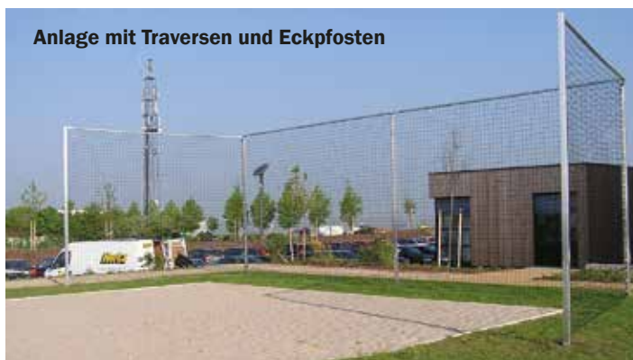
Anlage mit Traversen und Eckpfosten

! Zur erhöhten Stabilität empfehlen wir Quertraversen zwischen jedem Pfostenpaar. Das erhöht die Steifigkeit der Anlage und macht sie optisch ansprechender.