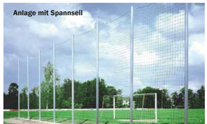
Anlage mit Spannseil